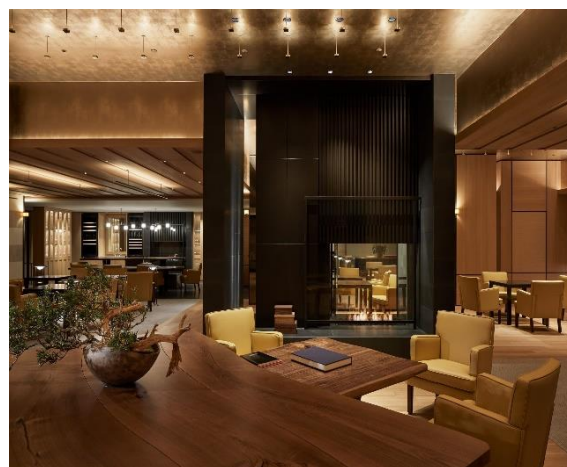
パーク ハイアット 京都のラウンジスペース「ザリビングルूम」

※上記写真ほか、オフィシャル写真データについては右記リンクよりダウンロード可能です。 http://bit.ly/2otAn0Y