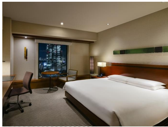
「ハイアット リージェンシー 東京」客室イメージ

ハイアット (hyatt.com) では、東京都内のホテル 1 「パーク ハイアット 東京」「アンダーズ 東京」「グランド ハイアット 東京」「ハイアット リージェンシー 東京」共通のオファーとして、本日より2020年11月10日までに予約を完了し、2020年9月17日から12月23日までに宿泊すると、宿泊料が25%オフになる