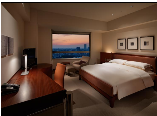
「グランド ハイアット 東京」客室イメージ