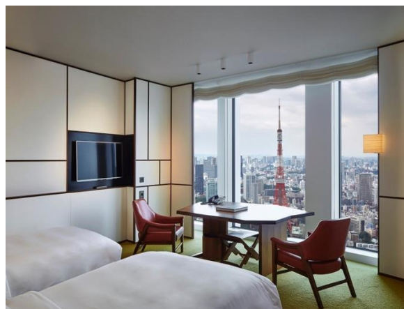
「アンダーズ 東京」客室イメージ